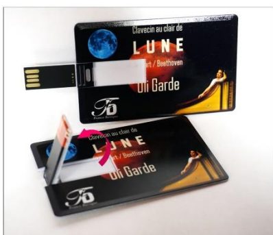
Ouverture de la carte

Nous sommes fiers de vous annoncer la sortie de l'album Clavecin au clair de Lune . L'enregistrement que nous avons fait en juillet dernier a pu être tiré en albums-cartes USB. Sans votre aide, lors de la campagne de financement participatif lancée en avril dernier, nous n'aurions pas pu y'arriver. Merci beaucoup !